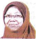
Pakar Perubatan Kesihatan Awam, Universiti Putra Malaysia (UPM)