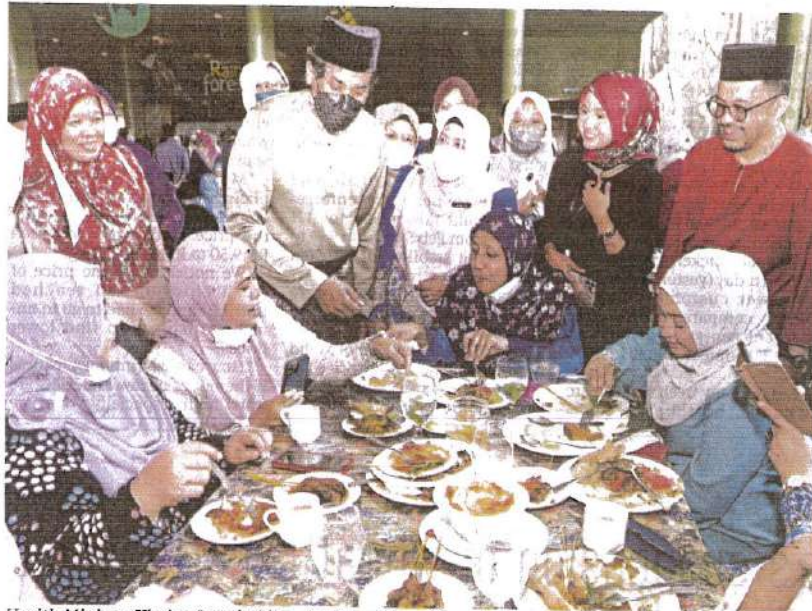
Health Minister Khairy Jamaluddin mingling with staff members at the ministry's Hari Raya Aidilfitri open house in Putrajaya yesterday.

pital admissions saw a slight increase, 55 per cent of the cases were in categories 1 and 2.