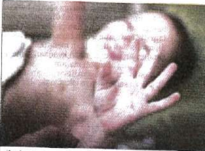
Ibu bapa atau penjaga diberi cuti kuarantin bagi memastikan anak pulih sepenuhnya dan bebas daripada tanda serta gejala HFMD. (Foto hiasan)

Malah, kanak-kanak berkenaan juga perlu dilap hingga kering bagi memastikan permukaan itu benar-benar bersih, manakala penggunaan tisu ba-