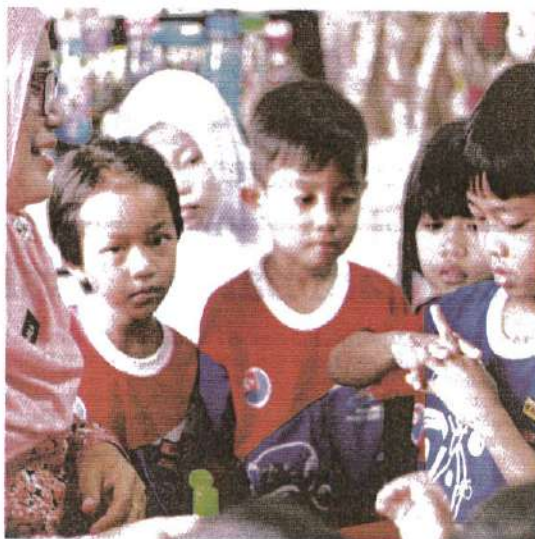
KES HFMD cepat merebak di pusat jagaan kanak-kanak, taska dan tadika. – GAMBAR HIASAN

Beliau berkata, sebanyak 889 wabak dilaporkan di Malaysia dengan tiga negeri tertinggi mencatatkan kejadian wabak ialah Kuala Lumpur dan Putrajaya iaitu 309 wabak (35 peratus), diikuti Selangor dengan 111 wabak (12