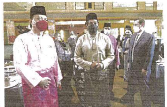
Khairy bersama Dr Noor Hisham pada Majlis Sambutan Aidilfitri KKM di PICC, Putrajaya, semalam.

Sementara itu, KKM akan meningkatkan pemberian ubat un-