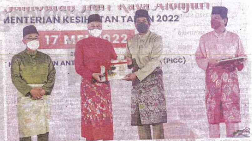
Khairy (dua dari kanan) menyerahkan buku Inisiatif Malaysia Hidup Bersama Covid-19 kepada Perdana Menteri, Datuk Seri Ismail Sabri Yaakob (dua dari kiri) pada Sambutan Aidilfitri Kementerian Kesihatan di Pusat Konvensyen Antarabangsa Putrajaya (PICC) pada Selasa.

"Jika kes banyak tetapi keseriusan kurang, ini bermakna kita boleh hidup dengan virus itu. Sekiranya ada varian baharu yang cepat merebak, mungkin kita akan ambil tindakan