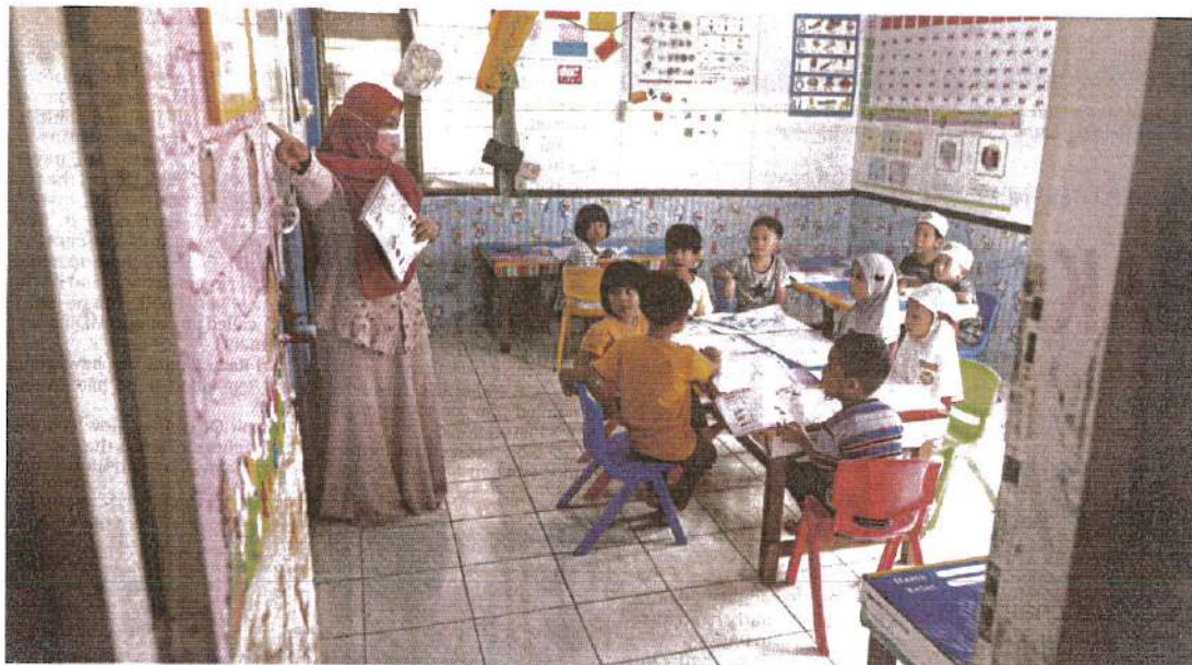
Classes conducted as usual at a kindergarten in Marang, Terengganu, amid the hand, foot and mouth disease outbreak in the country.

An outbreak is when two or more cases are detected in one