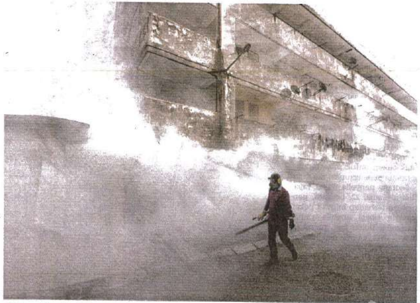
KES denggi tertinggi dicatatkan di Terengganu, Labuan diikuti Kedah dan Negeri Sembilan.

"Negeri Perlis, Melaka, Johor dan Pahang mencatatkan penurunan peratusan kes berbanding tahun lalu," kata kenyataan itu.