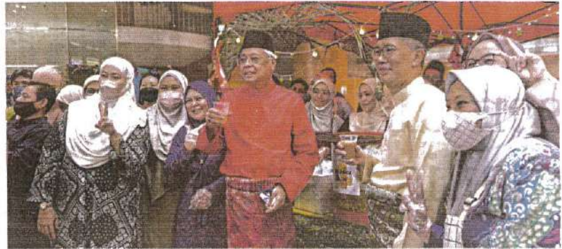
Ismail Sabri bersama Tengku Zafrul pada Majlis Sambutan Hari Raya Aidilfitri dan Rumah Terbuka Kementerian Kewangan di Putrajaya, semalam.